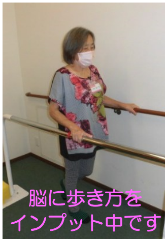
脳に歩き方を インプット中です!

【担当ケアママネ様より】 楽しい気持ちで気分転換して頂き、そして自宅での役割を果たせるように canon を続けてほしいです。